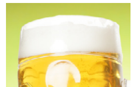
Brauereien und Mälzereien