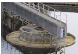
Klär- und Kleinkläranlagen